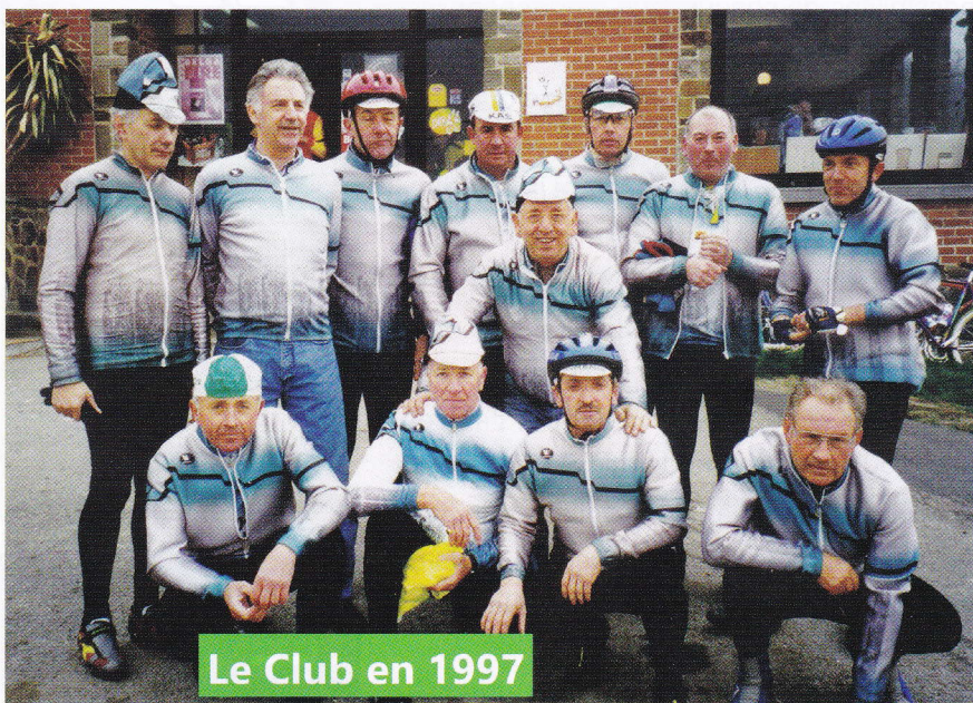
Le Club en 1997

L'année 1992 voit la création de la 1 ère organisation du cc Beaufays devenue un grand classique et très prisée des cyclos de tout le pays : « la Stan Ockers », du nom de ce cycliste belge légendaire, vainqueur de Liège-Bastogne-Liège, la flèche Wallonne, le championnat du monde et le maillot vert du tour de France dans la seule année 1955. Un monument en son honneur est érigé à l'entrée de Beaufays, non