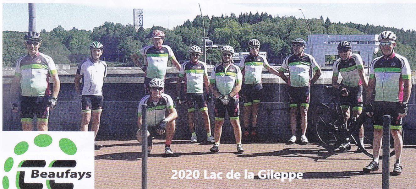
2020 Lac de la Gileppe